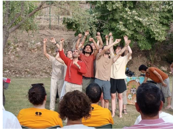
Ambite (Madrid), 20 junio 2025