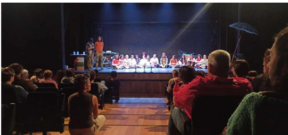
Facilitación del coloquio posterior. Centro Cultural Pilar Miró (28 septiembre 2025)