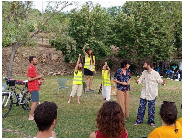
Ambite (Madrid), 20 junio 2025