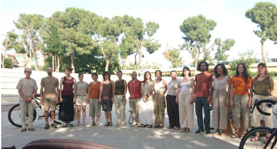
Representación en Madrid, 22 junio 2025 (Plaza Amós Acero)

Entramos a escena desde los dos laterales. Nos colocamos todos en semicírculo, postura y cara neutra, esperamos con naturalidad.