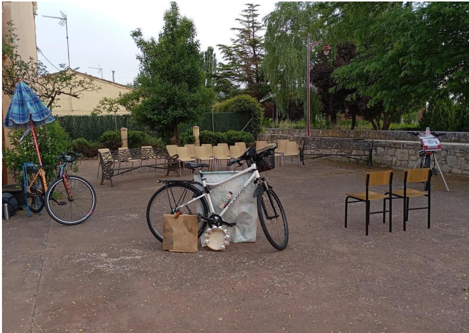
Nuestro primer escenario en Matillas (Guadalajara), 17 junio 2025

Necesitaremos dos sillas , que se colocarán centradas al fondo de la escena.