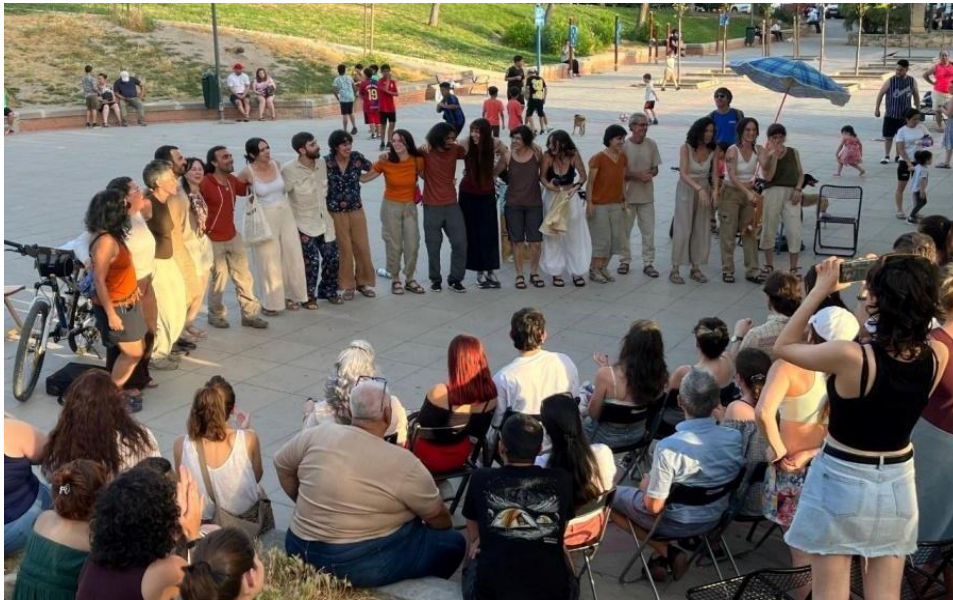
Final de la representación en la Plaza Amós Acero (22 junio 2025)