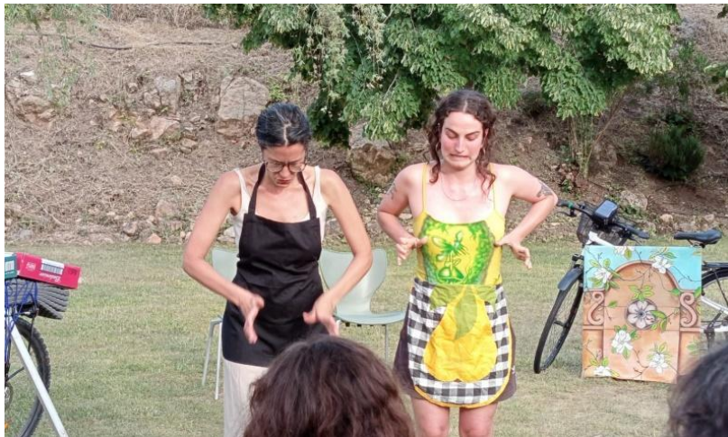
Ambite (Madrid), 20 junio 2025

Influ: (sorprendida y molesta) — “Pero, ¿cuántos churros necesitamos? ¿Cuánto se tarda en hacer un botijo?”